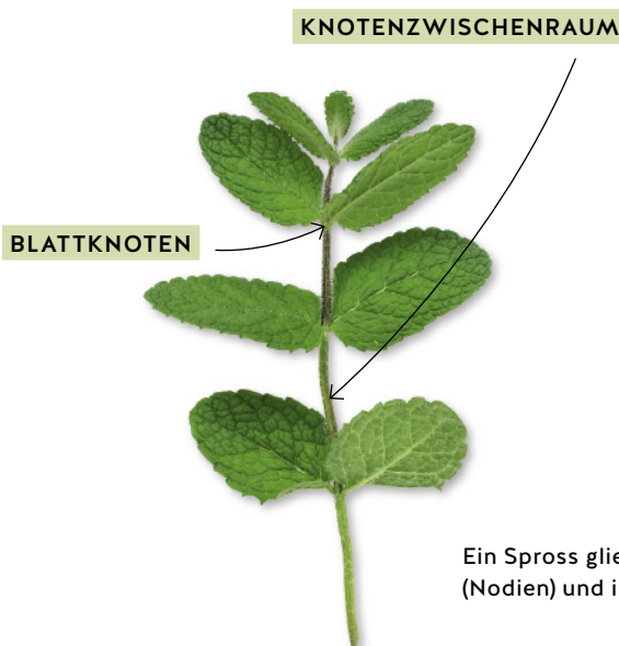
Ein Spross gliedert sich in Blattknoten (Nodien) und ihre Zwischenräume (Internodien).

In den Knoten, den Blattachsels, sorgt teilungsfähiges Gewebe dafür, dass seitlich neue Triebe entstehen können. Bleiben diese Seitenverzweigungen kurz, spricht man von Kurztrieben. An ihnen stehen die Blätter dann dicht gedrängt, z. B. in Büscheln wie bei der Lärche, oder