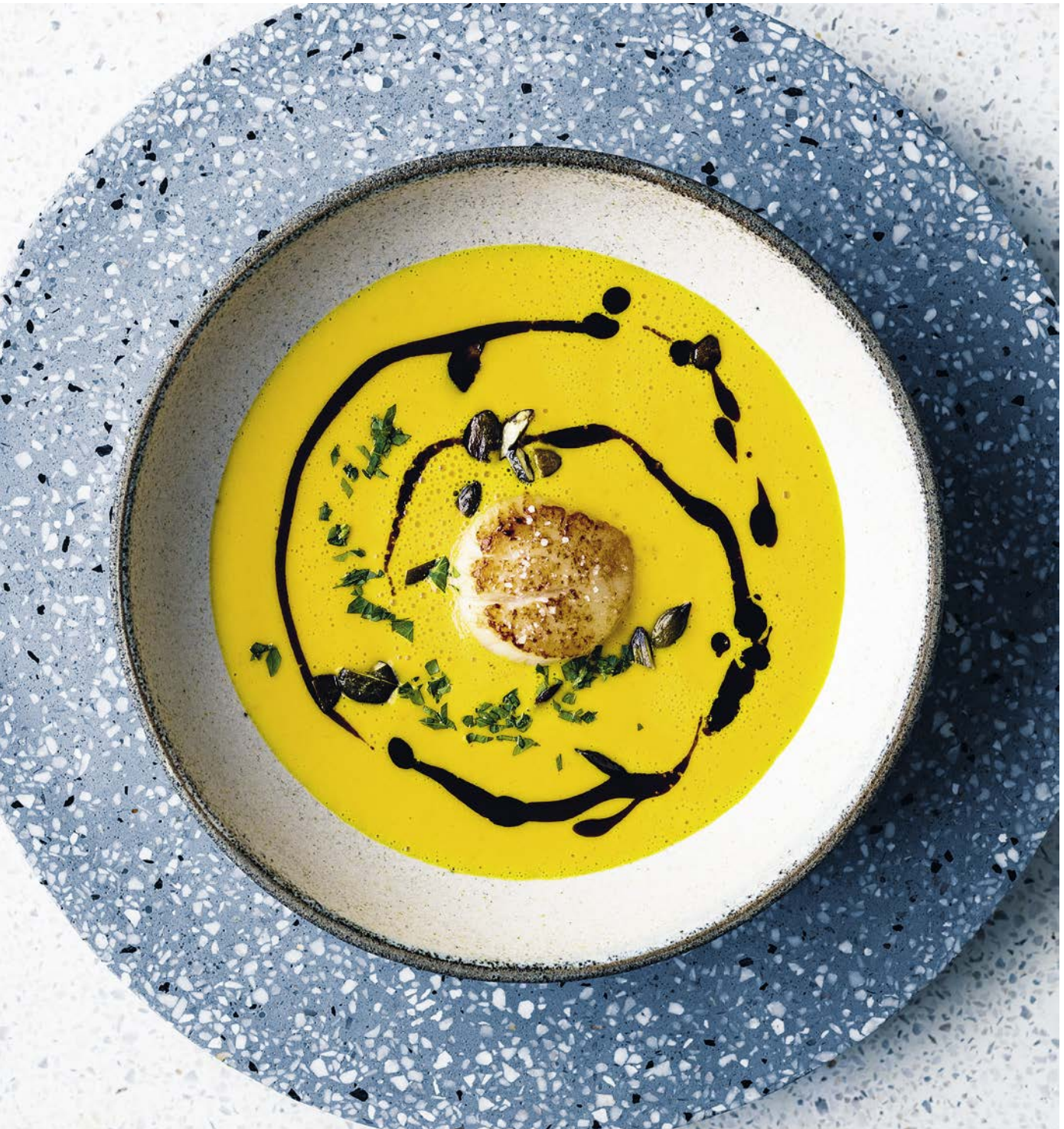
Kürbissuppe mit Jakobsmuschel