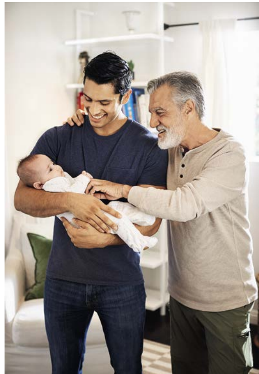
Eltern und Großeltern vererben ihre DNA und ihre Erfahrungen an das Kind.

Evolutionsbiologisch ergibt das durchaus Sinn: Wenn die Schwangere über Hormone dem Fötus mitteilt, dass er oder sie in einer sehr gefährlichen Umgebung zur Welt kommen wird, dann sollte sich der kleine Mensch besser darauf einstellen – und zum Beispiel früh geboren werden, um den Körper der Mutter nicht zu lange zu belasten, schon als Baby immer wachsam sein, schneller unruhig werden und eher weinen, wenn sich etwas in seiner Umgebung verändert. Wenn Frauen während der Schwangerschaft eine psychiatrische Diagnose wie Depression, Angst, Angst vor Geburt, Psychose, Phobie und/oder Essstörung 3 haben, erhöht sich