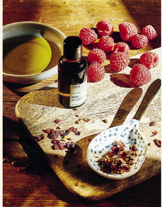
RESBERRAFACHER IN AKAUPRINZIENWÜRBESTE

Sichtbare Ergebnisse erreicht man im Hautbild meist nach vier Wochen, da ein Zell-Lebenszyklus so lange dauert. Wir arbeiten in Routinen, die für eine gewisse Zeit angewendet werden müssen, bis sie Ergebnisse zeigen.