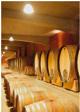
In aller Regel unter Verschluss: Weinfässer mit ihren kostbaren Inhalten.