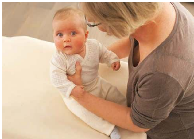
Lassen Sie Ihr Baby kurz zum unterstützten Sitzen kommen, bevor Sie es endgültig hochheben.