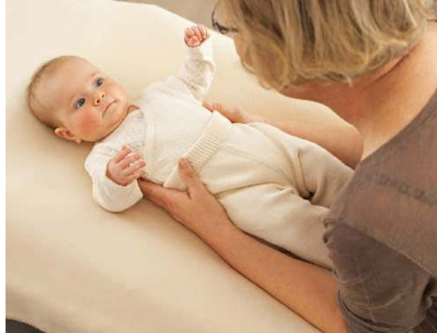
Zum Hochnehmen aus der Rückenlage nehmen Sie Ihr Baby zunächst im Schalengriff ...

Wenn Sie Ihr Baby aus der Bauchlage (in der Ihr Baby aber nicht schlafen sollte!) hochnehmen möchten, drehen Sie es zunächst zur Seite. Dazu stabilisieren Sie mit einer Hand Schulter und Rücken Ihres Babys und mit der anderen den Brustkorb. Sagen Sie ihm, was Sie vorhaben. Wenn es sich auf seinem unteren Arm etwas abstützen kann, ist es aktiv beteiligt. Dann neigen Sie Ihr Baby leicht nach vorn, sodass es kurz in einer gehaltenen sitzenden Position ankommt. Lassen Sie Ihr Baby beim Hochheben kurz den Kontakt zur Unterlage