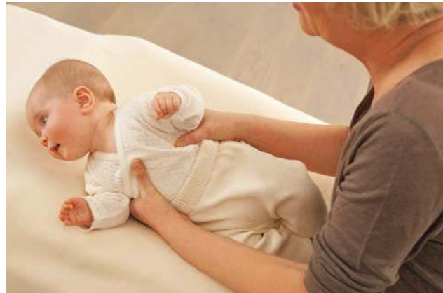
... Sie erklären ihm, was Sie mit ihm vorhaben, und drehen es dann auf die Seite, indem Sie Brust und Rücken mit beiden Händen stabilisieren.