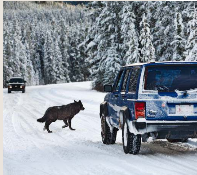
Einmal einen Wolf in freier Natur zu beobachten, davon träumen viele Tierfreunde.

» Wolf und Mensch besitzen beide die Fähigkeit zur Empathie, was wohl die beste Voraussetzung für eine artübergreifende, gemeinsame Zukunft war. «