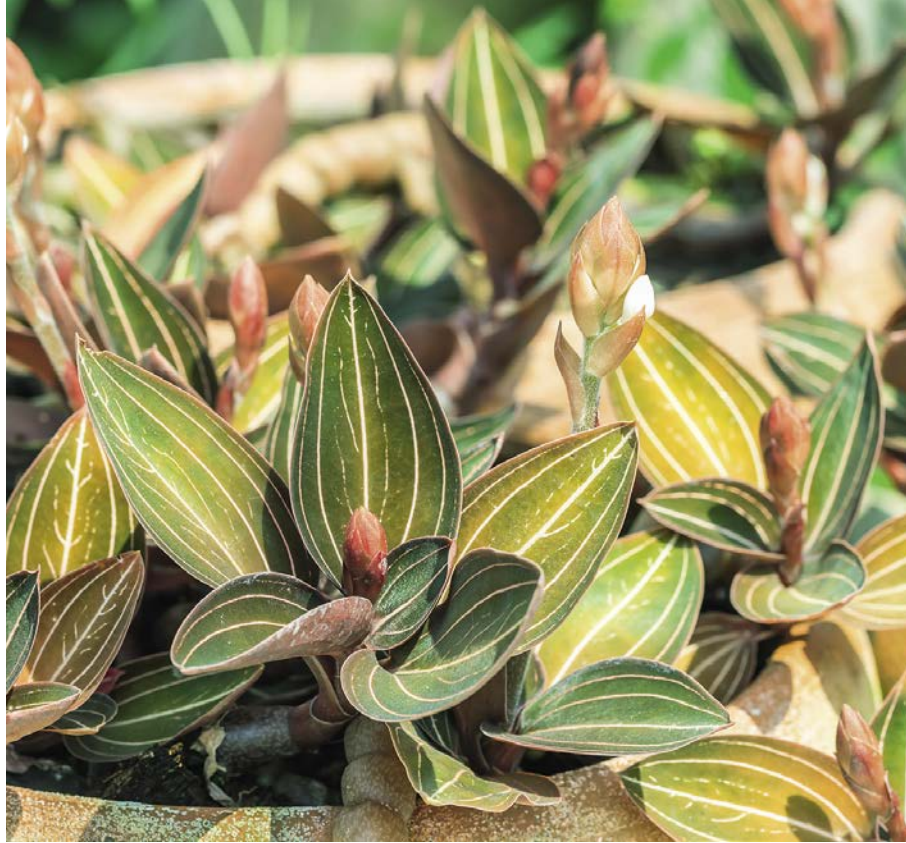
Die Chinesische Juwelenorchidee bedeckt mit ihren fleischigen Blättern an kurzen Ausläufern schon bald eine ganze Schale.

Die Pflege Die Ludisia ist ziemlich einfach zu pflegen, solange sie warm steht und man sie keiner direkten Sonneneinstrahlung aussetzt. Dann toleriert sie auch eine niedrige Luftfeuchte, wie z. B. auf dem Fensterbrett über einem Heizkörper an einem Nordfenster. Ihr Substrat muss locker und wasserdurchlässig sein, ohne zu schnell abzutrocknen. Man kann etwas Hornmehl oder -grieß untermischen, was schon fast die ganze Düngung ausmacht. Nach der Blüte im Frühjahr macht die Pflanze eine kurze Wachstumspause von wenigen Wochen. Danach treibt sie seitlich neue Sprosse aus und man kann sie monatlich mit einem han-