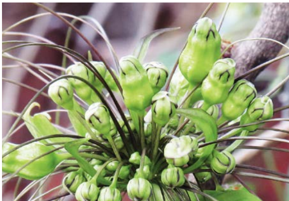
Die jungen, grünen Blüten färben sich später braun.

Die Pflege Unter möglichst gleichbleibenden Bedingungen, die einem subtropischen bis tropischen Klima ähneln (hohe Luftfeuchtigkeit, Zimmertemperaturen nicht unter 16–18°C) entwickeln sich Fledermausblumen meist recht gut. Insgesamt betrachtet ist die Kleine Fledermausblume leichter zu pflegen als die Große – und auch leichter zu bekommen. Gießen Sie beide Arten mit abgestandenem, zimmerwarmem Wasser. Besonders während der Heizperiode, wenn die Luftfeuchte sehr niedrig ist, hilft ein Luftbe-