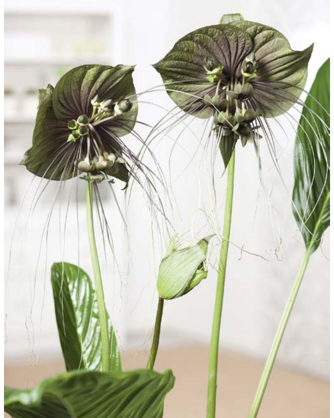
Wie extralange Schnurrhaare einer Katze hängen die Brakteolen herab.

feuchter, was auch für die menschlichen Schleimhäute günstig ist. Düngen Sie wöchentlich einmal mit 1% Flüssigdünger im Gießwasser, in den Wintermonaten verlängern Sie das Düngereinter-