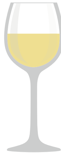
WEISSWEIN Auch für Aperitif- und Dessertweine geeignet