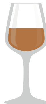
LIKÖRGLAS Klein und bauchig