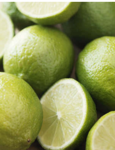
Leitaromen: Muskat, Limetten