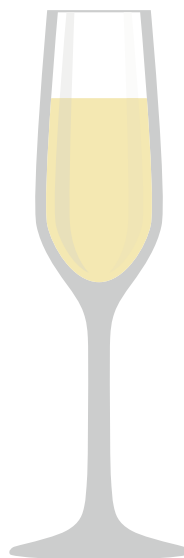
SCHAUMWEIN Hoch und schlank