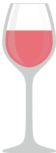
APERITIF- UND DES- SERTWEINE Klein und schmal