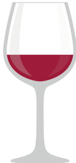
BURGUNDER Groß, Ballonform