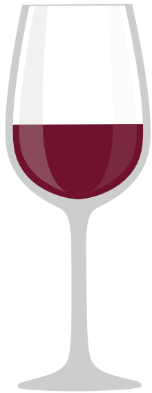
ROTWEIN Mittelgroßes Rotweinglas