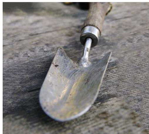
AUCH FÜR PFLANZSCHAUFELN GILT: HOCHWERTIGE MODELLE SIND IHREN PREIS WERT.

Diese ausgesprochen handliche kleine Version des Spatens ist ungemein vielseitig und praktisch. Außerdem lässt sich mit ihr sehr präzise arbeiten. Mit der Pflanzschaufel – auch Handschaufel genannt – graben Sie Pflanzlöcher, schichten Substrat um, jäten auch tief wurzelnde Unkräuter, lockern ruckzuck die Erdoberfläche auf, »öffnen« Wurzelballen und vieles mehr. Sie ist das unersetzliche Standardtool für alles, was mit dem Pflanzen, mit Erde und Substrat im Beet zu tun hat. Die Edelstahlvariante mit ebenso edlem Holzgriff ist hier die beste Entscheidung: Sie sieht gut aus und ist langlebig.