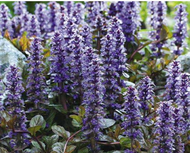
CHARMANTER BODENDECKER FÜR ALLE SCHATTENLAGEN: DER KRIECHENDE GÜNSEL.

Vor der Pflanzung den Boden gut lockern und mit humusreicher, frisch-feuchter Erde anreichern. Im Anschluss nur darauf achten, dass der Boden stets genügend feucht und nährstoffhaltig ist. Im Zweifel gibt man übers Jahr gelegentlich frische Komposterde hinzu. Nach der Saison die großen und wüchsigen Stars im Ensemble (Silberkerze, Knöterich, Wiesenraute) kräftig zurückschneiden, alle anderen befreit man erst im folgenden Frühjahr von »Altlasten«.