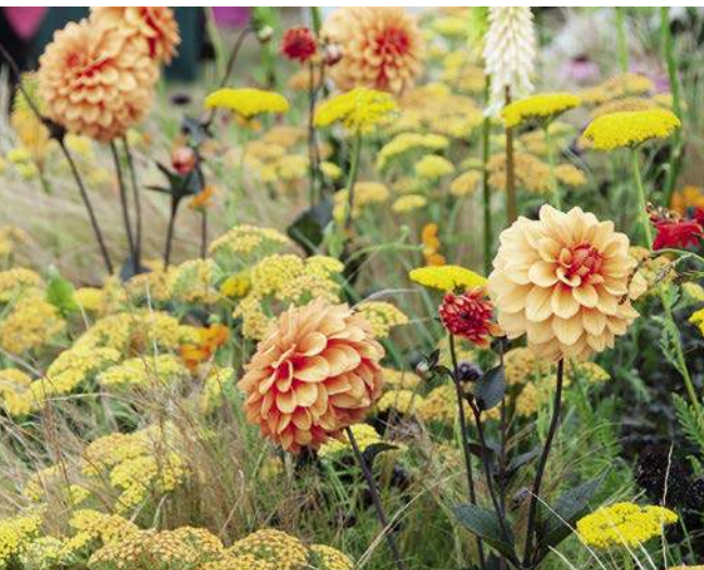
AN EINEM SONNIGEN PLATZ LAUFEN DAHLIE UND SCHAFGARBE ZU HOCHFORM AUF.

Und weil eben der Standort so entscheidend ist, sollten Sie am Anfang Ihre Beete möglichst an unproblematischen Standorten planen. Diese sollten weder zu trocken noch zu feucht sein und gern im lichten Schatten größerer Laubgehölze auf lockerem, nahrhaftem Grund liegen. Unter solchen Bedingungen gedeihen die allermeisten Beetprotagonisten gut. Außerdem sollte man das natürliche Anpassungspotenzial der Pflanzen nicht unterschätzen. Es überrascht im-