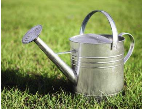
DIESE EDELSTAHLGIESSKANNE LIEGT GUT IN DER HAND UND IST EIN ECHTER HINGUCKER.