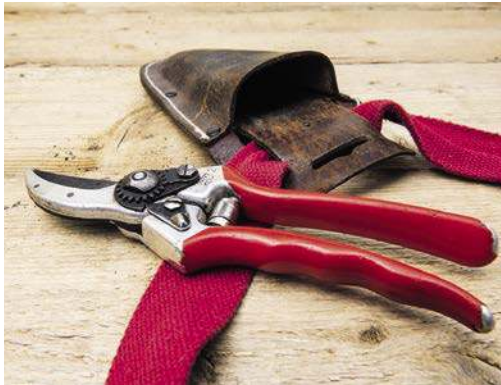
DES GÄRTNERS LIEBSTES ACCESSOIRE: GURT-TASCHE FÜR DIE GARTENSCHERE.

Mit diesen vier Tools haben Sie Ihren Garten immer im Griff!