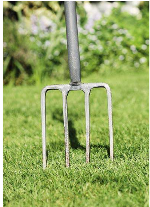
EINE SOLCHE GRABEGABEL IST UNVERWÜSTLICH UND BEGLEITET EINEN DURCHS GÄRTNERLEBEN.

Die allermeisten To-do's bezogen auf Bodenlockerung und Anlage von Pflanzflächen können Sie mit der Grabegabel genauso erledigen wie mit dem Spaten. Mit der Grabegabel lockern Sie effektiv, rückschonend und wurzelfreundlich den Boden und arbeiten Komposterde gründlich ein. Außerdem lassen sich größere Pflanzen, auch hartnäckige Wurzelunkräuter, wurzeltief aushebeln. Das unersetzliche Universalwerkzeug hält in hochwertiger Ausführung – robust, aber leicht und wetterfest – ein Gärtnerleben lang. Wichtig: Vor dem Kauf testen, ob der Stiel für Sie die richtige Länge hat!