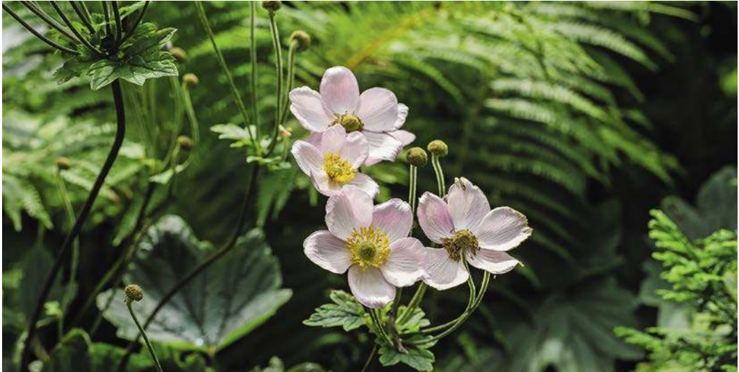
SCHÖNHEIT IM SCHATTEN: DAS LIEBREIZENDE BLÜTENSPIEL DER JAPAN-ANEMONE.

mer wieder, mit welcher suboptimalen Standorten manche Pflanzen zurechtkommen. Flächen im tiefen Schatten, in Mauernähe, an zugigen Ecken und nordexponierte Bereiche sind allerdings schwieriges Terrain. Dort sollte man Beete erst anlegen, wenn man schon etwas Erfahrung gesammelt hat.