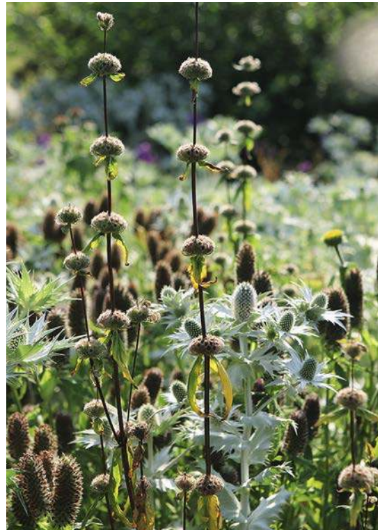
WERDEN UND VERGEHEN: AUFBLÜHEN UND VERBLÜHEN GEHÖREN ZUSAMMEN.

Beete, die übers Jahr ungestört wachsen dürfen und über Jahre stehen bleiben, sind von hohem ökologischem Wert und ein Gewinn für die Natur. Sie sind eine erstklassige Nahrungsquelle und ein Rückzugsort für die heimische Fauna.