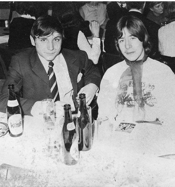
Das rechts bin ich im Februar 1969 – mit Beatles-T-Shirt und als stolzes Bandmitglied von The Nowhere Men.

Eigentlich war es beschlossene Sache, dass ich als Vollblutmusiker ein international geachteter Schlagzeuger werden würde. Letzten Endes hinderten mich daran nur meine Finanzen. Stän-