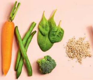
Gemüse, Sesam, Sojasauce, Dashi, Zucker

Eier werden in Japan oft mit Sojasauce gewürzt. Man lässt sie auch gerne in einer Dashibrühe und Sojasauce stocken.