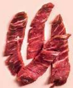
Fleisch, Sojasauce, Mirin, Zucker

Gekochtes Gemüse harmoniert wunderbar mit einer Sesamsauce. Sie besteht aus zerstoßenem Sesam, Sojasauce, Dashibrühe und Zucker. Auch zu Fleisch passt diese Sauce sehr gut.