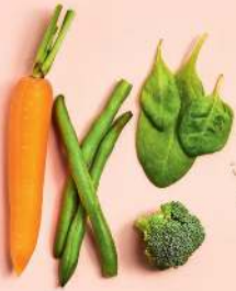
Gemüse, Sesam, Sojasauce, Dashi, Zucker

Eier werden in Japan oft mit Sojasauce gewürzt. Man lässt sie auch gerne in einer Dashibrühe und Sojasauce stocken.