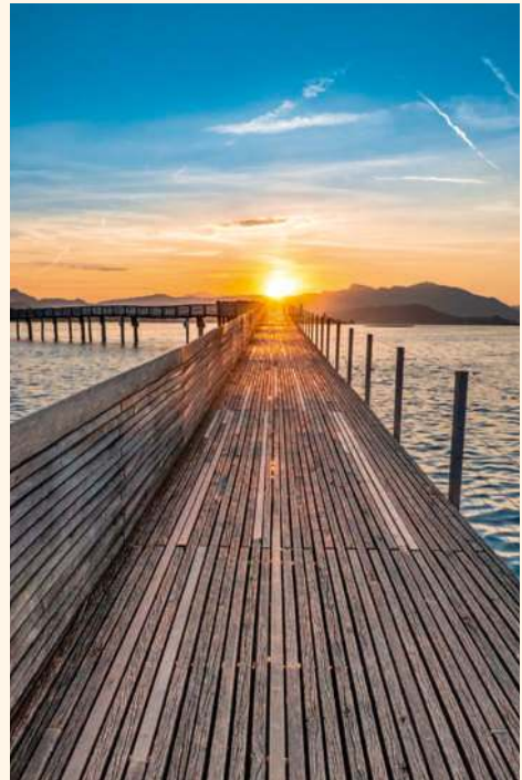
Das Strömen der Energiepunkte öffnet den Weg für Gesundheit, Vitalität und Lebensfreude.

Wenn Sie Beschwerden plagen, Sie aber Ihr Buch nicht zur Hand haben: Eine erste Linderung kann es oft schon bringen, wenn Sie beide Hände nebeneinander auf die schmerzende Stelle legen.