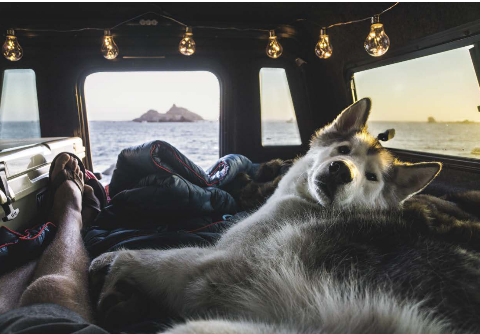
Crescent City, Kalifornien