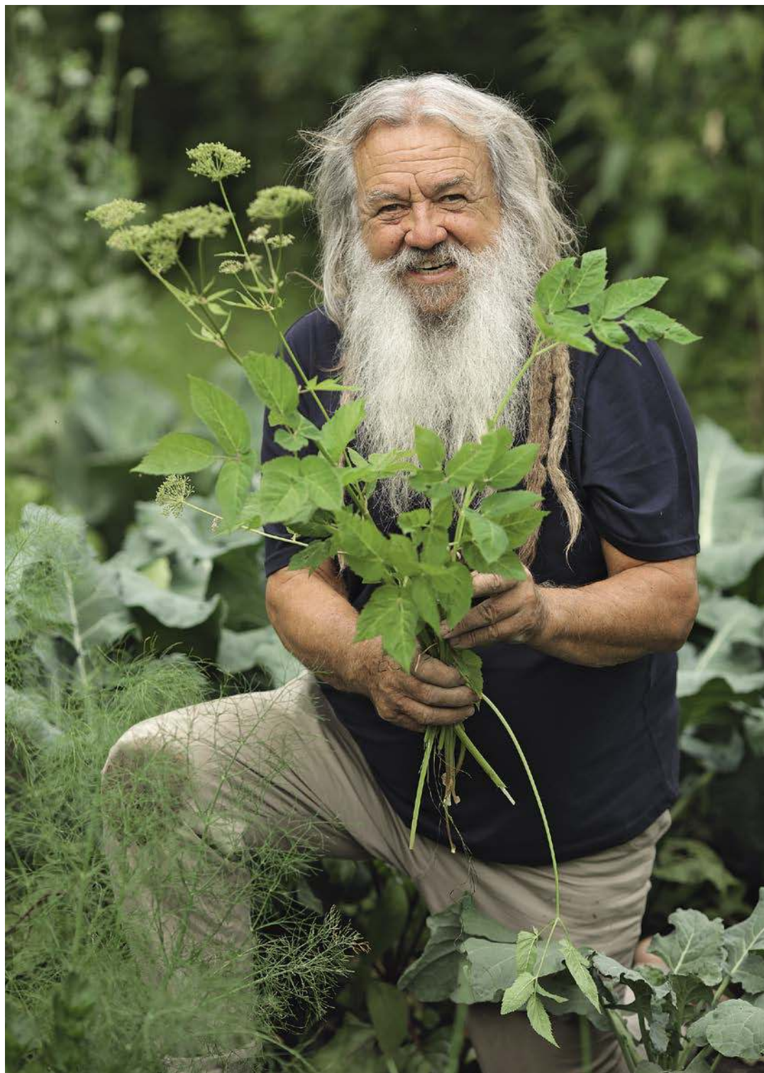
Aus meinen Gemüsebeeten entferne ich den Giersch – die Blätter kommen dann in die Suppe.