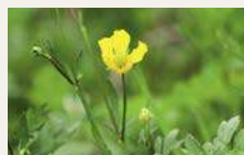
Kriechender Hahnenfuß 171