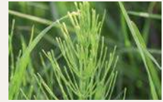
Acker- schachtelhalm 47