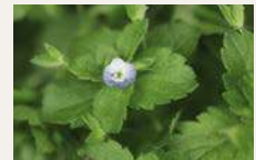
Persischer Ehrenpreis 85