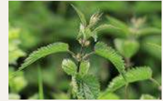
Große Brennnessel 65