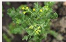
Gewöhnliches Greiskraut 147