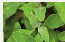
Weißer Gänsefuß 129