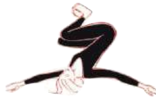
Krokodil (dynamisch) (45)