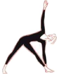
Gestrecktes Dreieck (52) (beide Seiten)