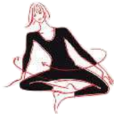
Um die innere Achse kreisen (16)