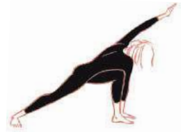
Gedrehte Flankendehnung (55) (beide Seiten)