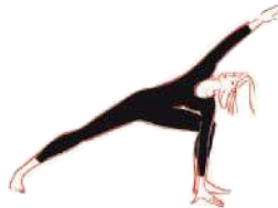
Gestreckte Flankendehnung (54) (beide Seiten)