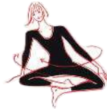
Um die innere Achse (16) kreisen