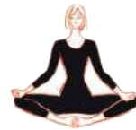
Geschlossener Winkel (43)