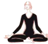
Tief atmen mit Reibelaut (74)