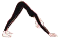
Hund, Gesicht unten (37) (beim Ausatmen Nabel einziehen)