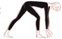
Flankendehnung, Variante (50)