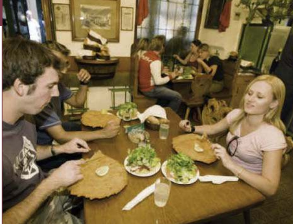
Schnitzel bei Figlmüller

Wien stellt auch gastronomisch seit Jahrhunderten einen Schnittpunkt zwischen Ost und West dar. Das Ergebnis ist die Wiener Küche, die es bei einem Besuch der Stadt schwer macht, auf sein Gewicht zu achten. Die Restaurants haben Weltruf, wobei das Angebot natürlich weit über Wiener Schnitzel und Tafelspitz hinausgeht.