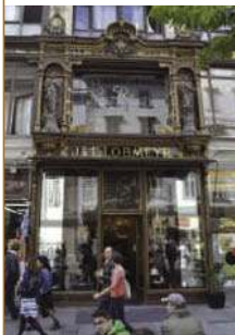
J. & L. Lobmeyr

Das Casino Wien bietet anschließend die Chance, das geplünderte Bankkonto wieder aufzufüllen – oder auch nicht. In jeden Fall sollte das Budget aber noch für eine original Sachertorte reichen, die das Hotel Sacher 8 in allen Größen auch zum Mitnehmen anbietet.