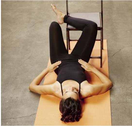
Lege einen Unterschenkel im 90-Grad-Winkel nach außen rotiert auf einen Stuhl.

Rotiere den Oberschenkel so weit nach außen, wie es für dich geht, ohne das Becken zu verschieben. Dieser Test ist wichtig, da es einen bei den vielen hüftöffnenden Übungen leicht frustrieren kann, wenn man auch bei regelmäßigem Üben keinen Fortschritt erkennt. Spürst du jedoch noch Dehnung in den Oberschenkelinnenseiten, dann heißt es fleißig weiterdehnen.