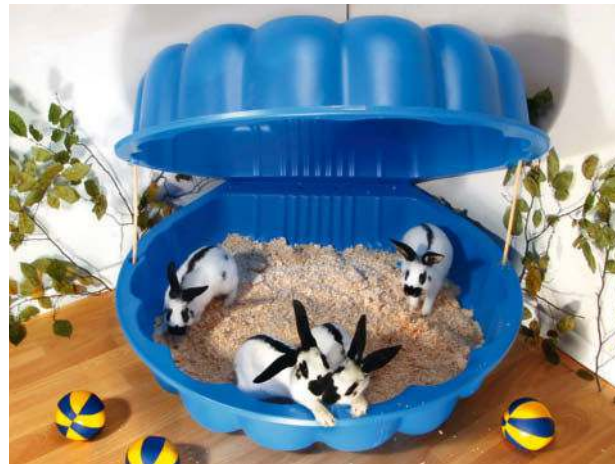
Die Sandmuschel ist ein echtes Wellnessparadies. Der Öffnungsgrad der Schale lässt sich variieren.