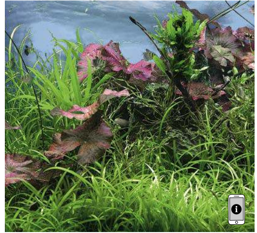
Dieses Aquarium ist schon länger eingerichtet. Die Pflanzen müssen bald gelichtet werden.

einrichten wollen, denn in diesen Bereich gehört kein anderer Bodengrund.