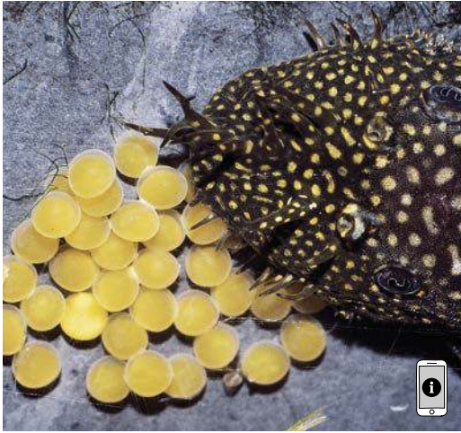
Ein junges Wels-Männchen betreut die Eier seines Geleges in einer Bruthöhle aus Steinen.