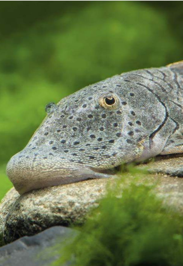
Dieser Gebirgharnischwels weidet mit seinem »Gummimaul« Algen ab.

Jedes Lebewesen hat sich auf seine Art in der Umwelt etabliert, in der es entstanden ist. Daraus resultierten die unterschiedlichsten Anpassungen in Verhalten und Körperbau. Sie führten zu der großen Artenvielfalt.