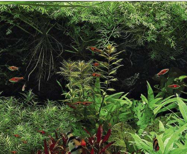
Hier ruht ein Schwarm Espes Keilfleckbärb-linge im Schutz des Pflanzendickichts.

Einrichtung: Der Bodengrund wird für gründelnde Arten wie Panzerwelse und Barben mit Sand und Feinkies ausgestattet. Verstecke bieten ein paar kleine Wurzeln, die auch Unterstände für Ruhephasen der Panzerwelse bieten. Nur im 100-Liter-Becken sind ein oder zwei Höhlen für die Stachelaale vorgesehen. Am wichtigsten ist die Bepflanzung. Alle Becken erhalten eine teilweise Abdeckung der Wasseroberfläche durch schwimmende Pflanzen, die besonders für scheue Schwarmfische Deckung bietet (→ Eltern-Tipp, Seite 117). Durch sie wird es teilweise schattig, was wiederum den langsam wachsenden Wasserkehlchen ( Cryptocoryne ) guttut. Die Deko-Wurzeln werden zusätzlich mit Javafarn bepflanz, der Beckenhintergrund im kleinen Becken