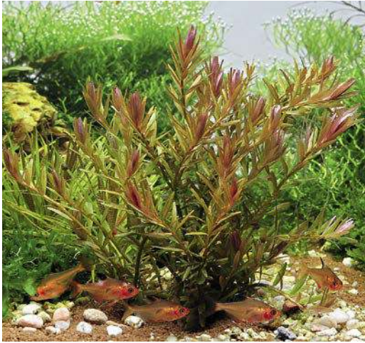
Ein erst kürzlich eingerichtetes Aquarium mit einer Gruppe frisch eingesetzter Blutsalmler.