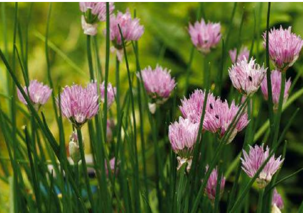
Allium schoenoprasum Schnittlauch