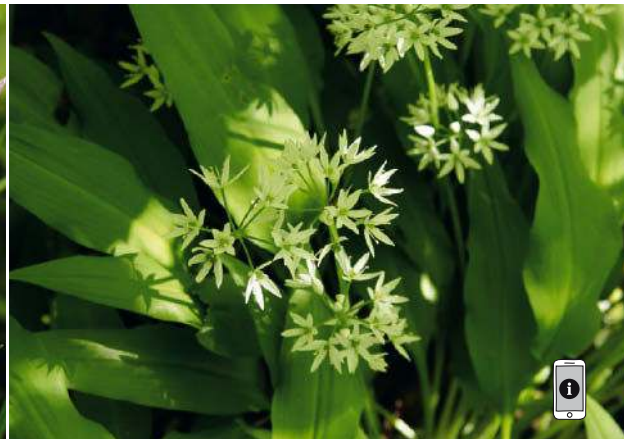
Allium ursinum Bärlauch

Küchentipps Lässt sich gut frostet. Die Blüten geben eine essbare Spisedekoration ab.