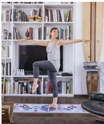
3. Balance Dance: verbessert das Gleichgewicht und die Koordination (Seite 90)