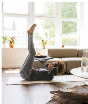
3. Julius Schraube: kräftigt die untere Bauchmuskulatur (Seite 25)