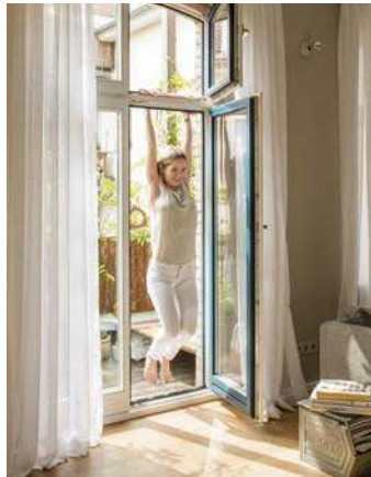
1. Aushängen: lockert und entlastet den Rücken (Seite 60)

Wenn meine Kundinnen ihre Periode haben, bedeutet das für uns Trainingspause. Ich persönlich liebe diese innere Uhr der Natur, die uns Frauen jeden Monat signalisiert: Time-out, Baby, und Füße hochlegen. Gleichzeitig fühlen wir uns aber meist gerade dann aufgedunsen und unattraktiv. Bewegung kann da ein besseres Körpergefühl schenken. Aber bitte nicht hochintensiv und anspruchsvoll, sondern möglichst liebevoll.