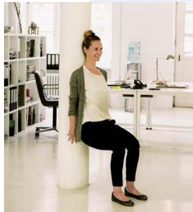
2. An-Lehn-Stuhl: unkompliziertes Oberschenkeltraining (Seite 37)