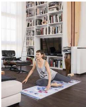
4. Brezel: sorgt für einen wohlgeformten Po (Seite 48)