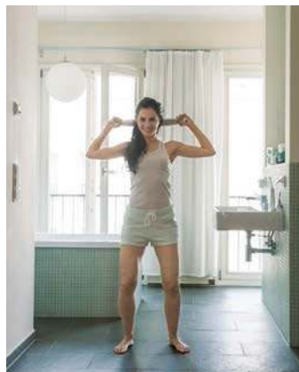
4. Handtuch-Lat-Zug: für Rücken- und Schultermuskulatur (Seite 63)