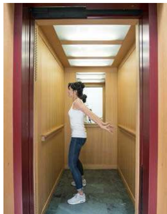
1. Topi-Top: macht schöne Oberarme für sexy Kleider (Seite 72)

Egal, ob Hochzeitswalzer, Klassentreffen oder Galadinner: Es gibt diese Abende und Veranstaltungen, da wollen wir einfach extrem spitze aussehen. Folgende Übungen schenken Ihnen die Aufrichtung, um sich schlanker zu schummeln – und Muskelkater an wichtigen Stellen, um sich knackig und sexy zu fühlen.