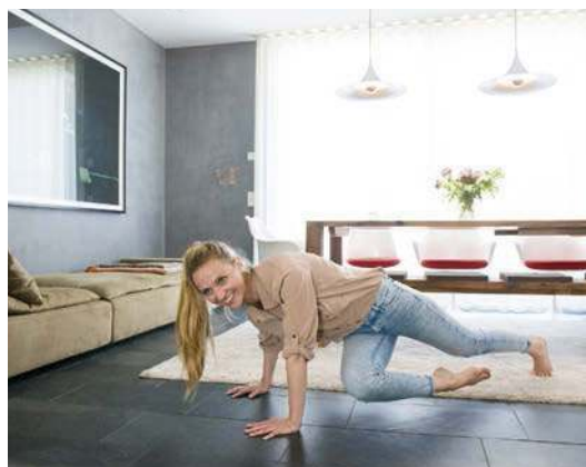
2. Liegestütz-Twist: strafft Arme und Bauch (Seite 31)