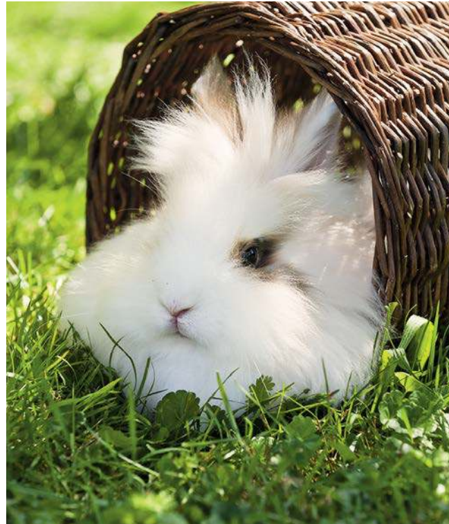
Die Röhre aus geflochtener Weide bietet dem Löwenkopf-Zwerg einen schattigen und zugleich luftigen Ruheplatz.

Wildkaninchen leben in unterirdischen Bausystemen, die eine Gesamtlänge von 45 m erreichen können und bis zu 3 m tief sind. Hier finden sie Schutz vor ihren Feinden, aber auch vor schlechter Witterung und ziehen ihren Nachwuchs auf. Ob es draußen schneit, regnet, stürmt oder die Sonne vom Himmel brennt: Unter der Erde lebt es sich angenehm trocken und stets wohltemperiert. Doch ohne Fleiß kein Preis! Ausgestattet mit seinen kräfti-