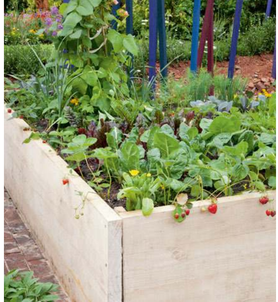
Holz ist perfekt für den Bau von Hochbeeten und Beet-einfassungen in jeder Größe.