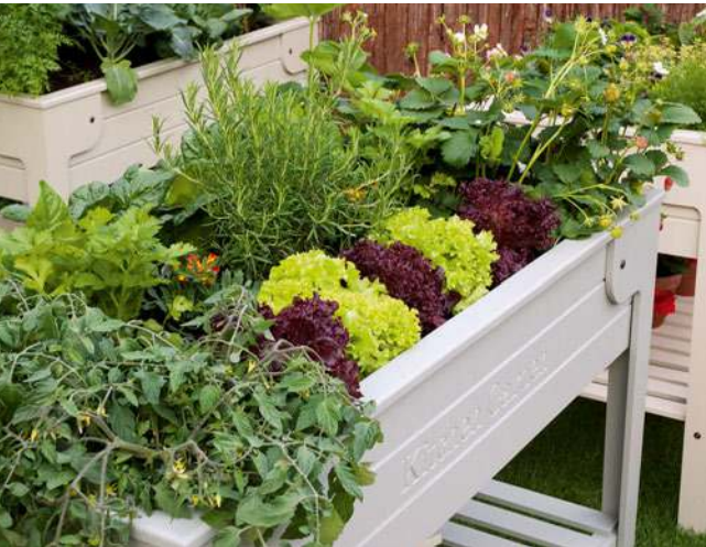
Bausätze für solch kleine Hochbeete sind wegen ihres geringeren Gewichts ideal für den Balkon.

Für den Bau von Hochbeeten in Eigenregie eignet sich vor allem Holz, weil es sehr leicht zu verarbeiten ist. Je nach Geschick können Sie Ihr Hochbeet neu aus Brettern bauen oder alte Kisten oder Holzpaletten nutzen. Ganz einfach geht es mit einem Fertigbausatz.