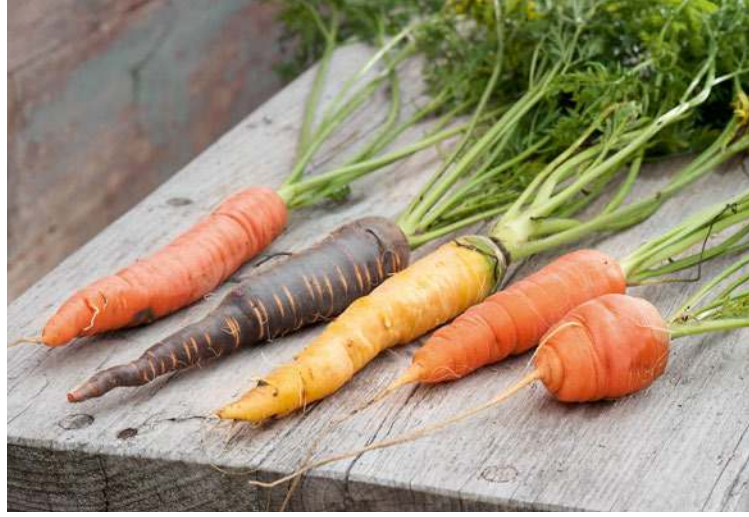
'Rodelika', 'Purple Haze', 'Mello Jello', 'Robila' und 'Parmex'