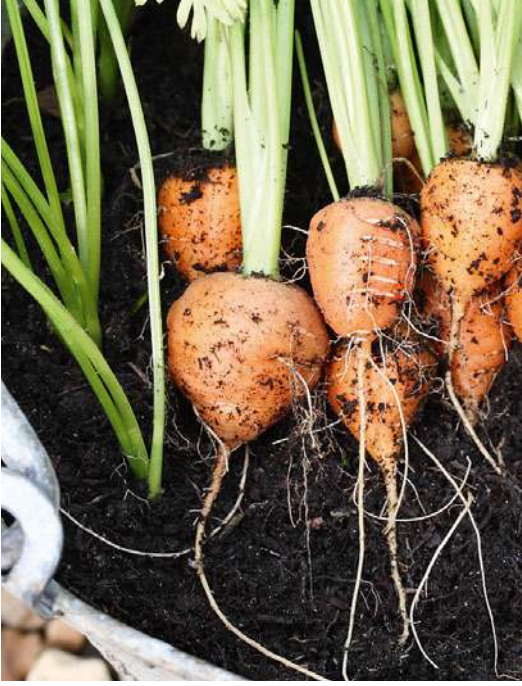
Runde Möhre 'Rondo'