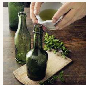
1. Das Kraut zerkleinern. 2. Den Saft mit dem Wein mischen. 3. Den Wein in die Flasche füllen.