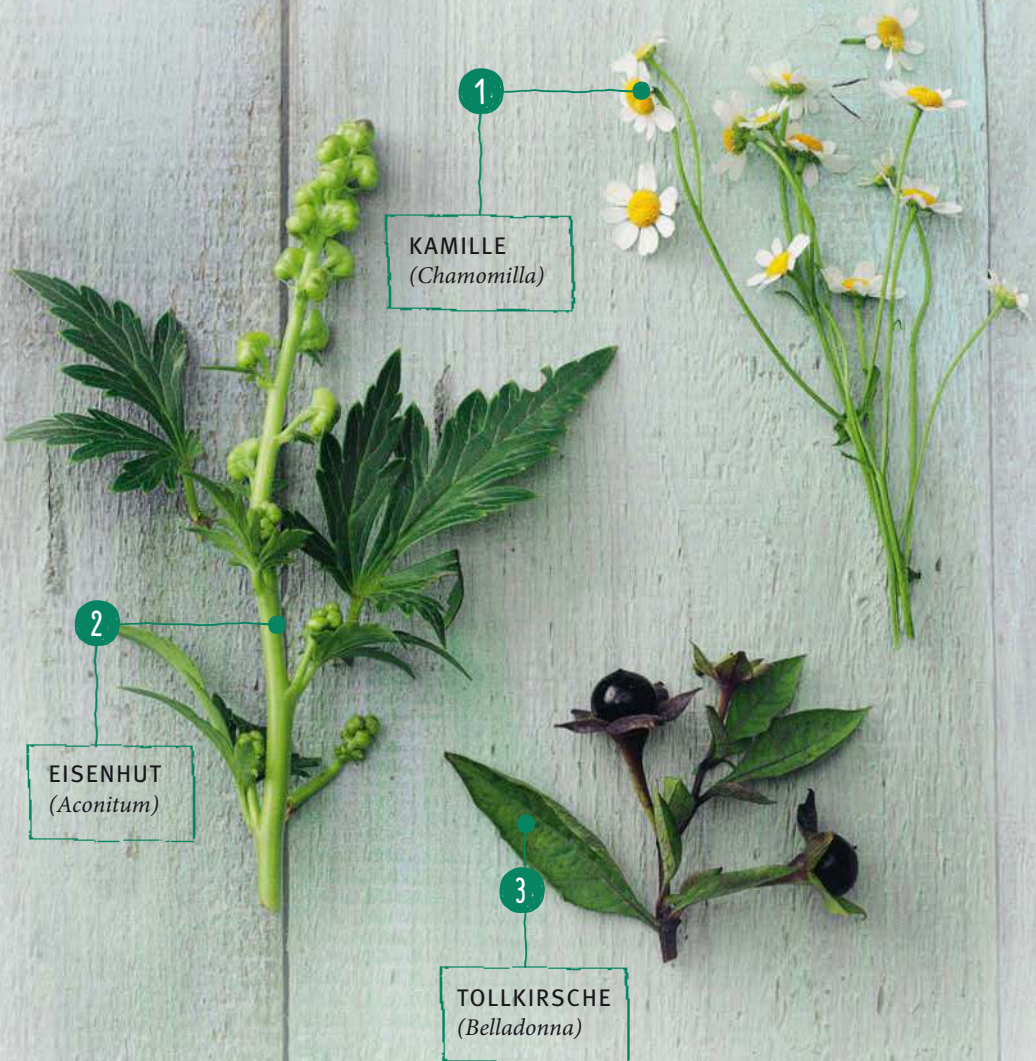
TOLLKIRSCH ( Belladonna )