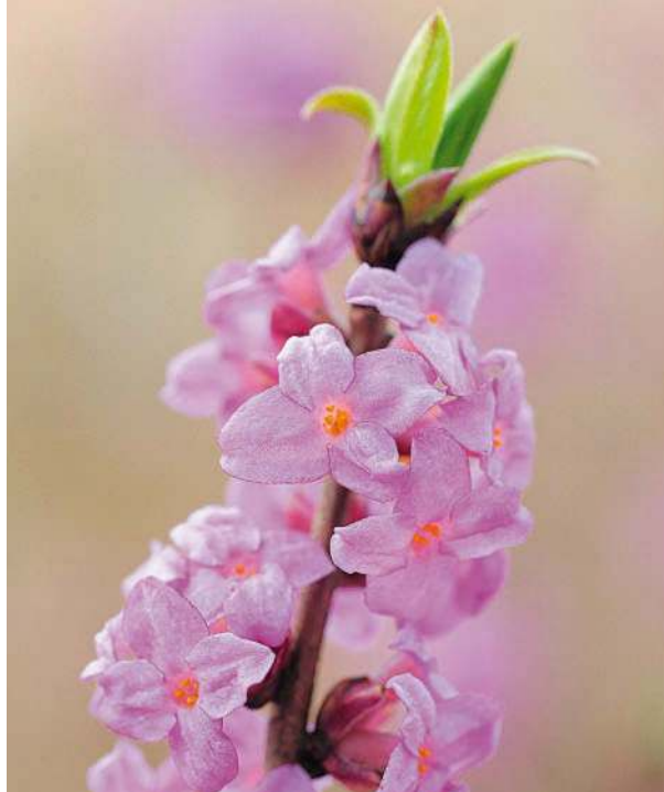
Mezereum (Seidelbast) ist neben Rhus toxicodendron hilfreich bei Jucken und Brennen.

Mezereum D12: Neben fast unerträglichem Juckreiz brennt und schmerzt die Haut Ihres Kindes stark. Die leichteste Berührung, etwa durch Kleidung, verschlimmert die Beschwerden. Um die Bläschen hat sich ein roter Hof gebildet. Schlimmer sind die Beschwerden nachts und durch Bettwärme.