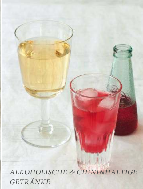
ALKOHOLISCHE & CHININHALTIGE GETRÄNKE