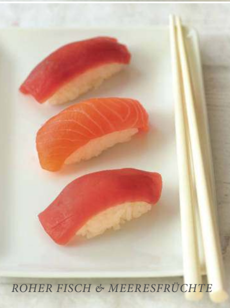
ROHER FISCH & MEERESFRÜCHTE