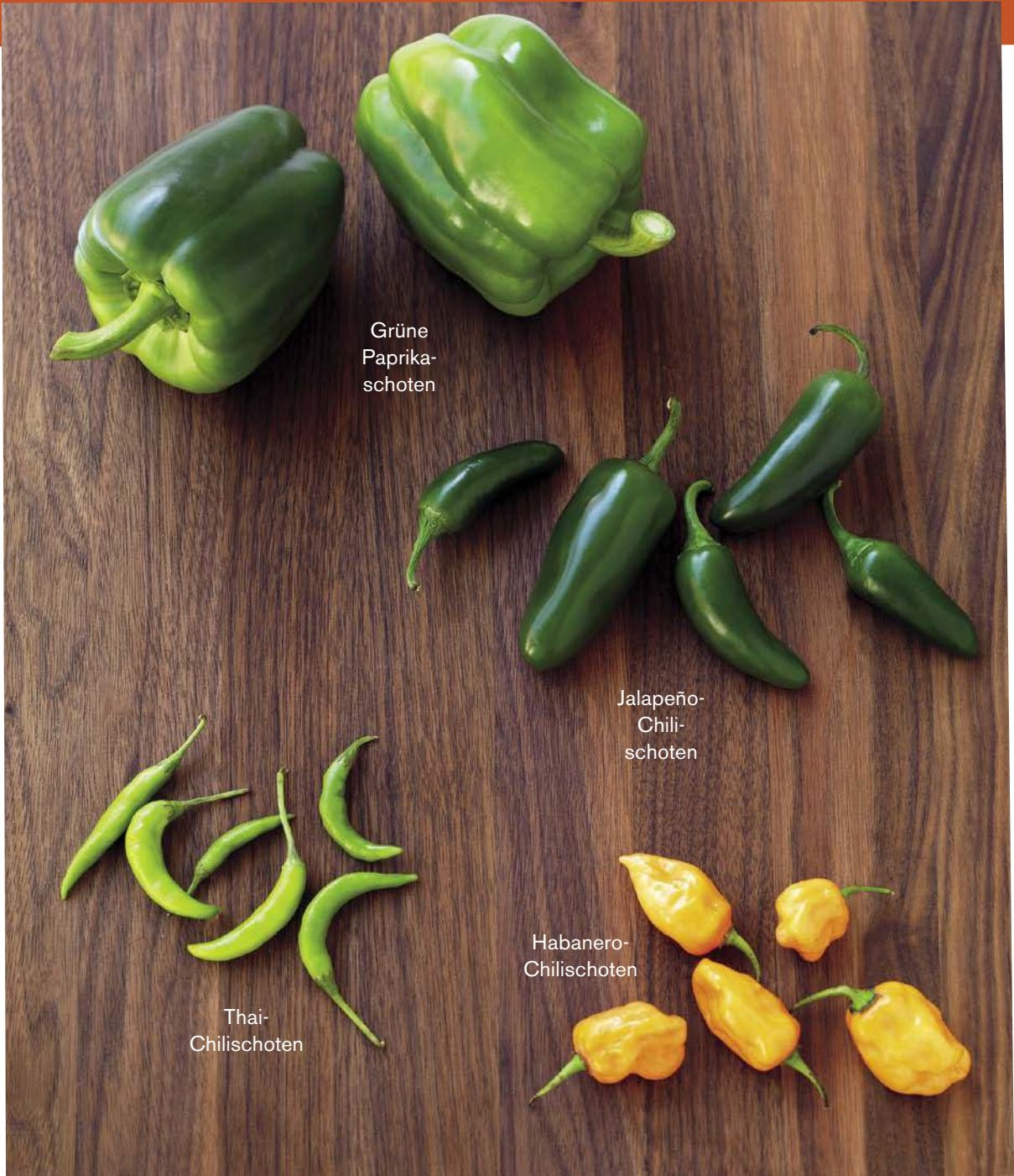
Grüne Paprika- schoten