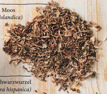
Schwarzwurzel ( Scorzonera hispanica )