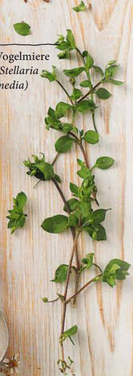
Vogelmiere ( Stellaria media )