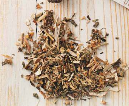
Wolfstrapp ( Lycopus europaeus )