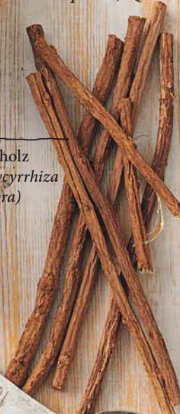
Süßholz ( Glycyrrhiza glabra )