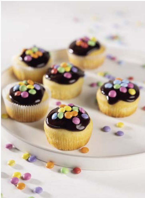
Smarties Muffins 81