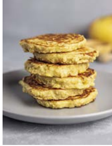
Softe Pancakes 75