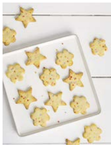
Bunte Konfetti Kekse 95