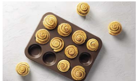
Zarte Zimtschnecken 101