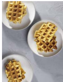
Die besten Waffeln 89