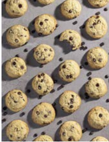
Choc Chip Cookies 73