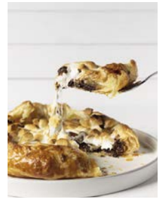
Süße Pizza 53