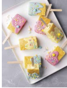
Kuchen am Stiel 77