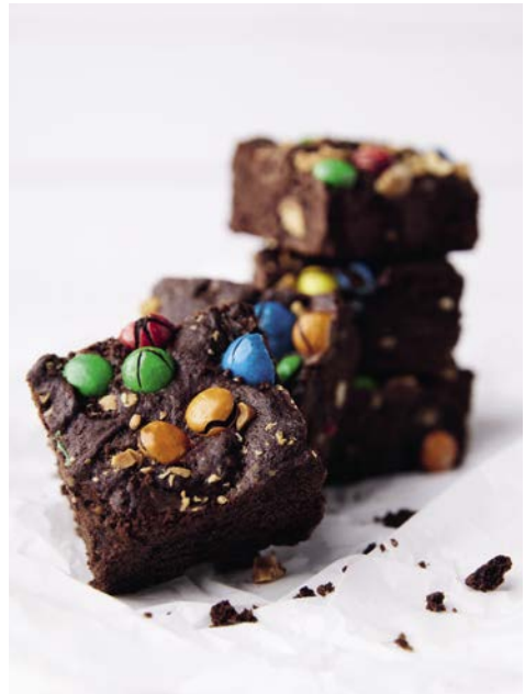
Softe Cookie-Bars 63