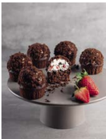
Maulwurf Cupcakes 93