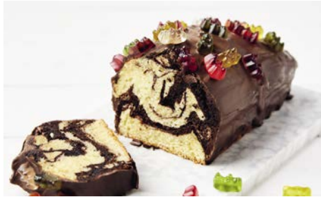
Saftiger Marmorkuchen 43